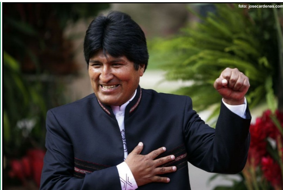
Evo Morales, el hombre que durante más tiempo ha gobernado a Bolivia.

Evo Morales se convirtió el miércoles 21 de octubre en el presidente que más tiempo ha permanecido en el poder en Bolivia, donde goza de un sólido apoyo popular y un crecimiento económico sin precedentes.