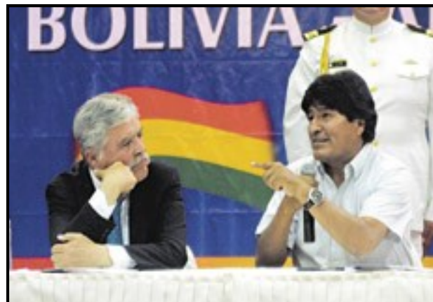
Julio De Vido y Evo Morales destacaron la importancia estratégica y política de los acuerdos.

Evo Morales destacó que “América latina atraviesa tiempos de integración y cooperación, y en ese marco