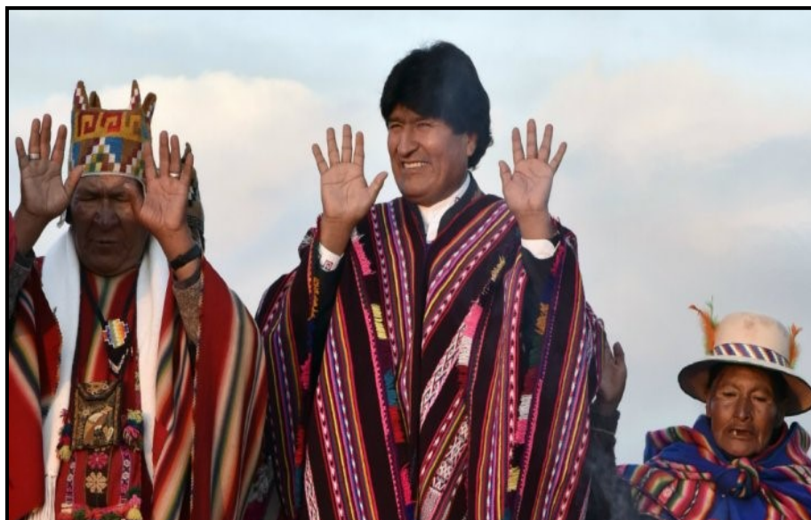
Evo Morales est l'homme qui a gouverné la Bolivie pendant le plus longtemps

Mercredi 21 octobre, Evo Morales est devenu le président qui est resté au pouvoir le plus longtemps en Bolivie, où il jouit d'un solide soutien populaire et d'une croissance économique sans précédent.